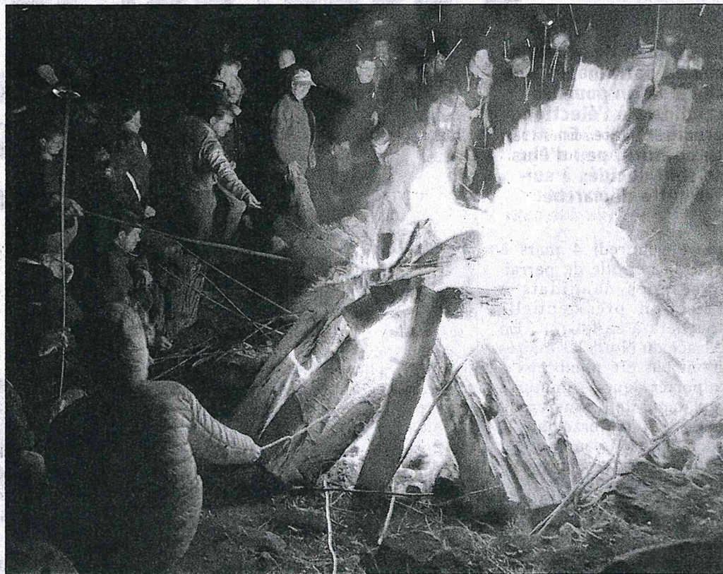
Les visiteurs se réunissent autour du bûcher pour se réchauffer ou enflammer leurs rondelles.