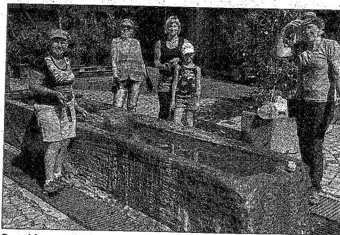
Parmi les nombreux chantiers, figurait le nettoyage des fontaines.