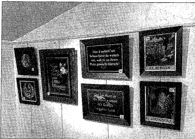
La peinture sous verre demande beaucoup de précisions et de temps, ce qui explique la valeur souvent élevée des œuvres.

inventé la technique. Elle consiste à fixer une mince feuille d'or ou d'argent sur la face recto d'une plaque de verre puis à la protéger avec des vernis ou des peintures à l'huile.