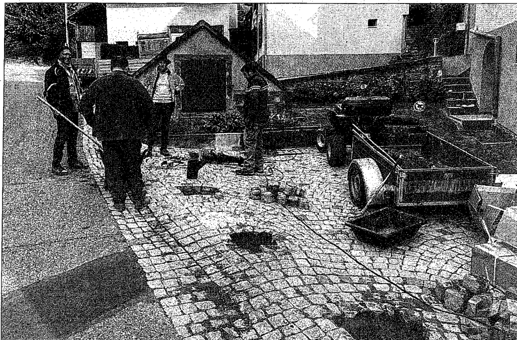
Des plots en fonte ont été mis en place devant la fontaine du Kandelbronne.

Près de 20 élus ont ainsi retroussé leurs manches pour réaliser différents chantiers dans le village. Plusieurs travaux de voirie ont été réalisés, grâce aux compétences qu'ont en la matière plusieurs membres du